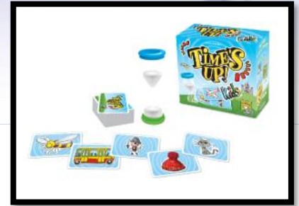
Time's up: juego cooperativo