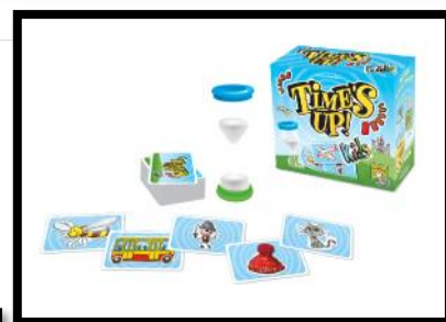
Time's up: joko lankidea